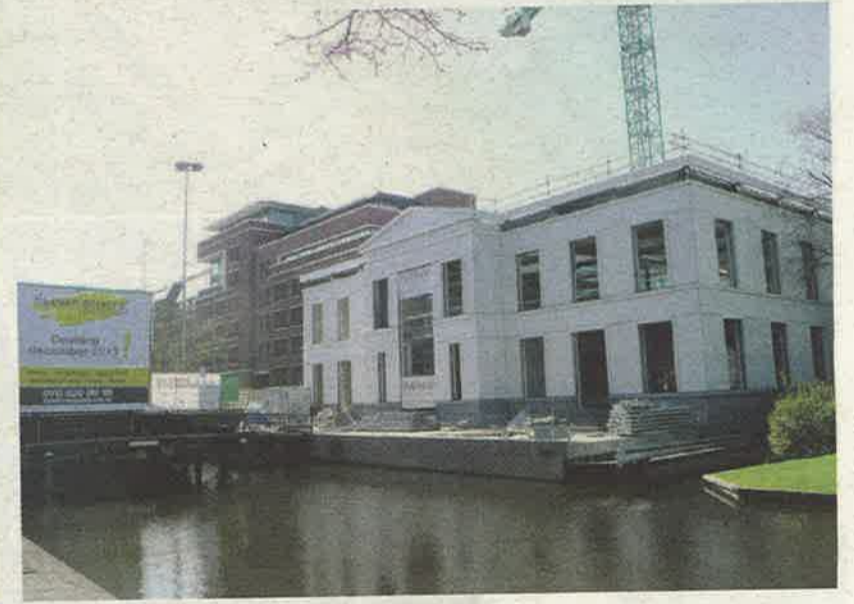
De nieuwbouw aan de Mauritskade.