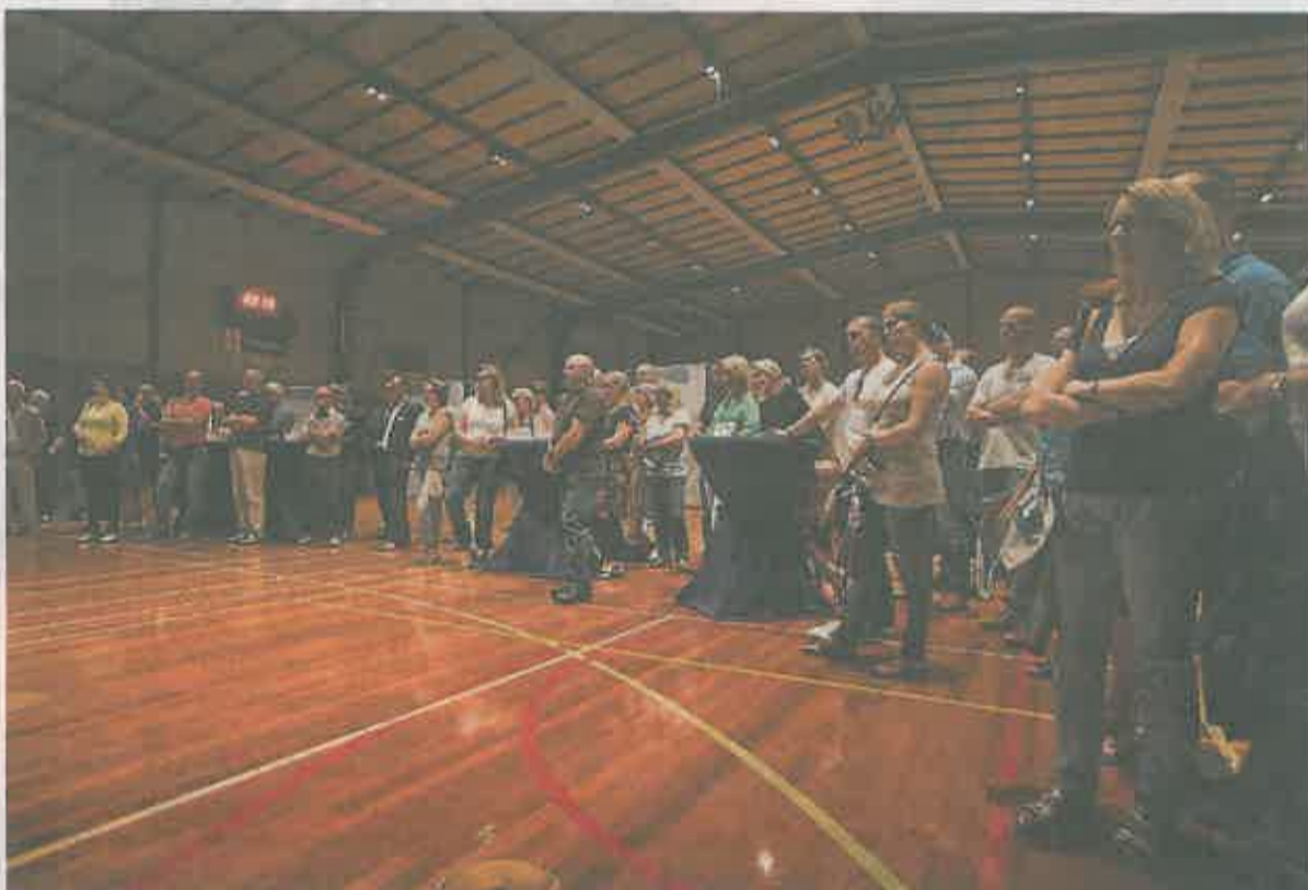
De voorlichtingsavond over project De Ring werd maandagavond druk bezocht.

Bij een ander bord vertelt een stedenbouwkundig specialist van de gemeente dat het gebied rondom het complex autoluw moet worden. Compleet met 'een openbaar beweegplein', waar kinderen uitgedaagd worden om te bewegen.