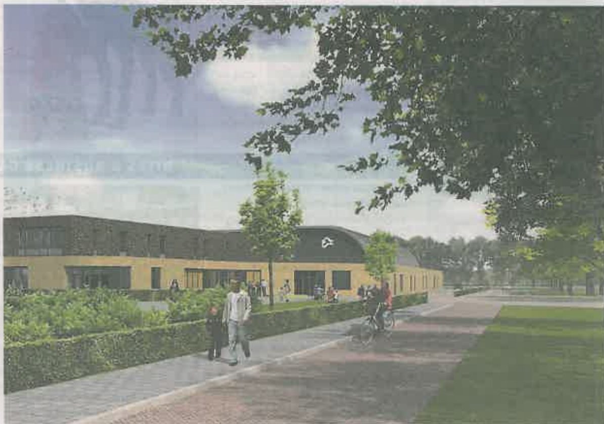
Artist impression van het project aan de kant van het Pleiadenplantsoen.