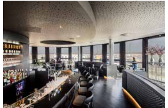
Boven: Het viersterrenverblijf beantwoordt de regionale behoefte aan hotelkamers en stimuleert de bedrijvigheid